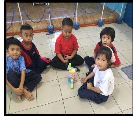
Kumpulan 3 : Bot laju