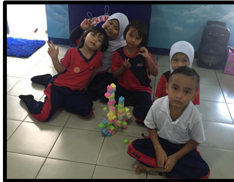
Kumpulan 2 : Kapal Laut